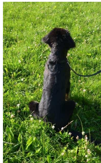
Mens vi venter